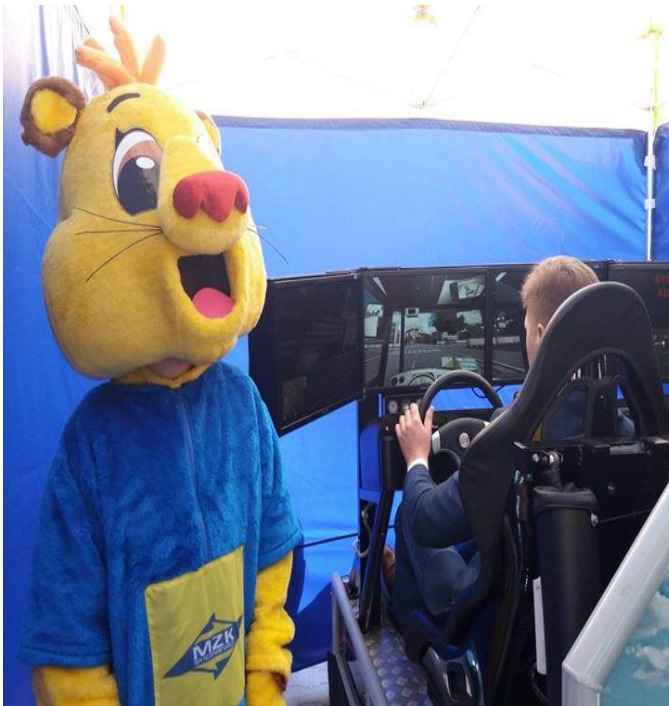
Skierniewickie Święto Kwiatów Owoców i Warzyw