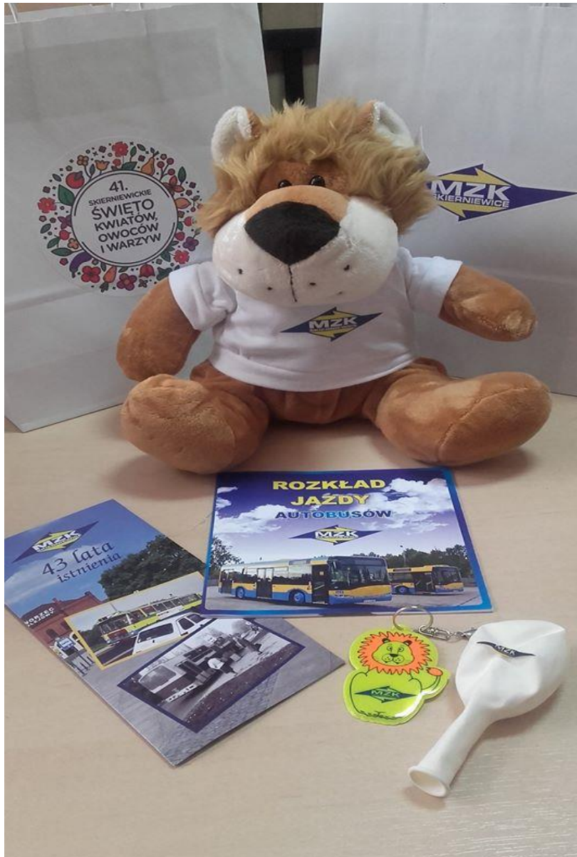
Skiernewickie Święto Kwiatów Owoców i Warzyw