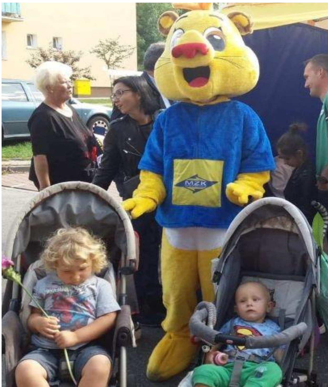
Skiemiewickie Święto Kwiatów Owoców i Warzyw